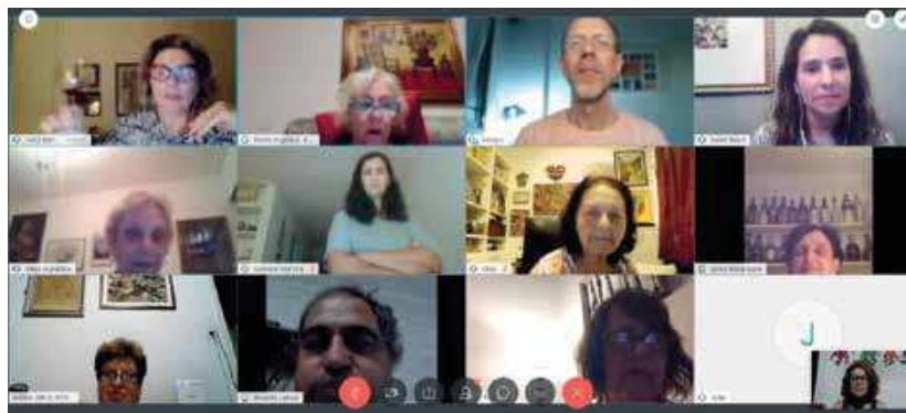
Videoconferência realizada dia 23/3

Neste período de quarentena o associado poderá ainda ver on-line o conteúdo histórico que está no painel da entrada da garagem. Basta acessar o site do Paulistano, www.paulistano.org.br . Ainda no site, estão disponibilizadas revistas antigas do Clube.