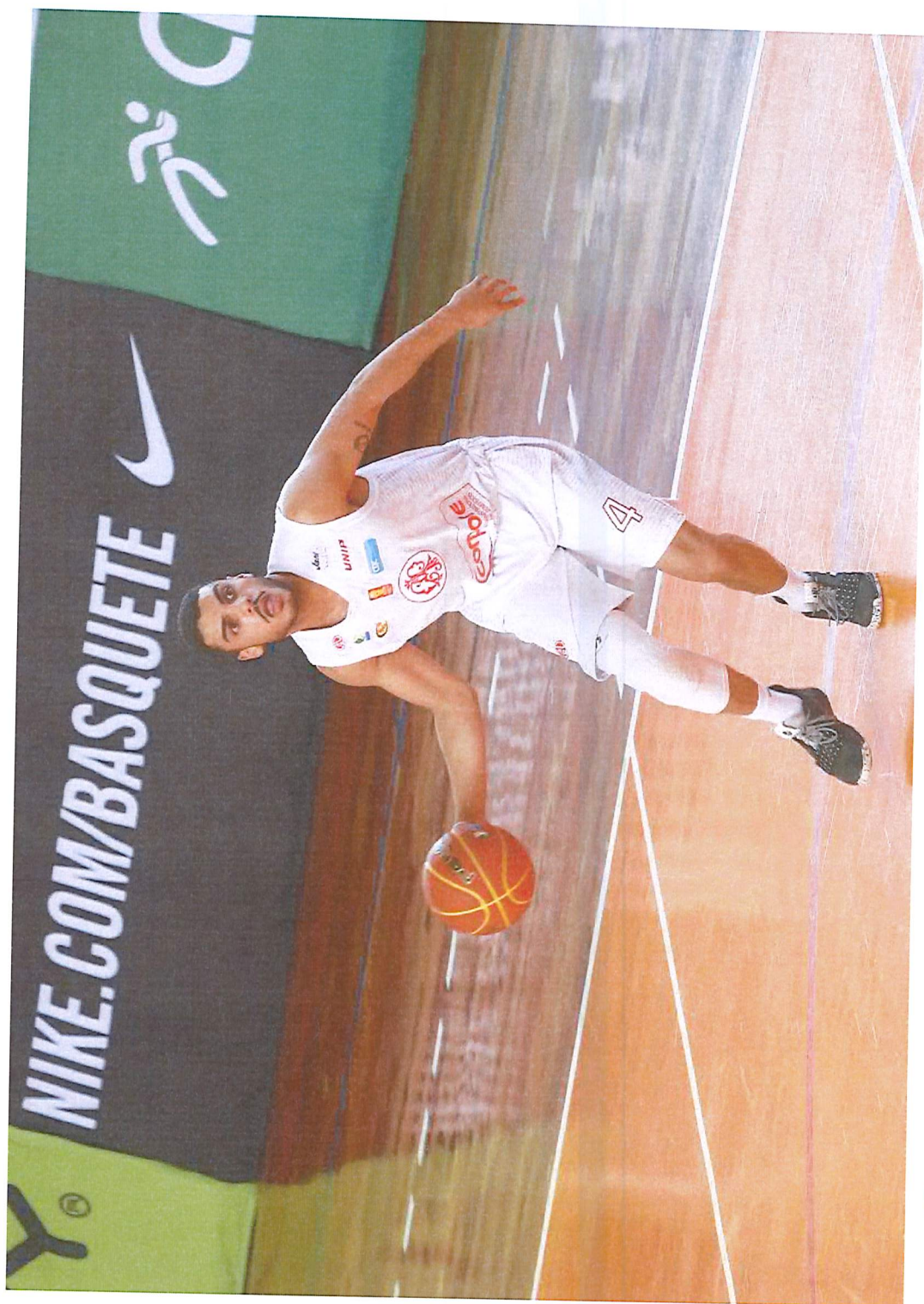
3 – Aposição do Selo de Formação de Atletas nos uniformes dos Atletas