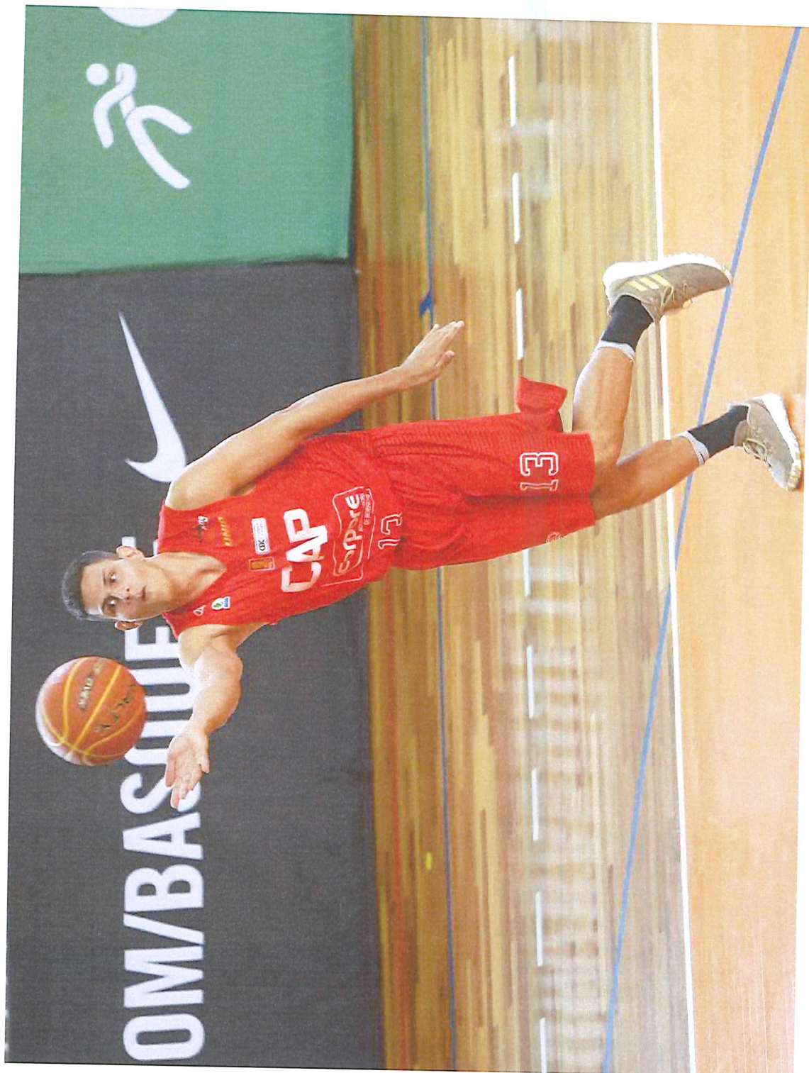
4 – Aposição do Selo de Formação de Atletas nos uniformes dos Atletas