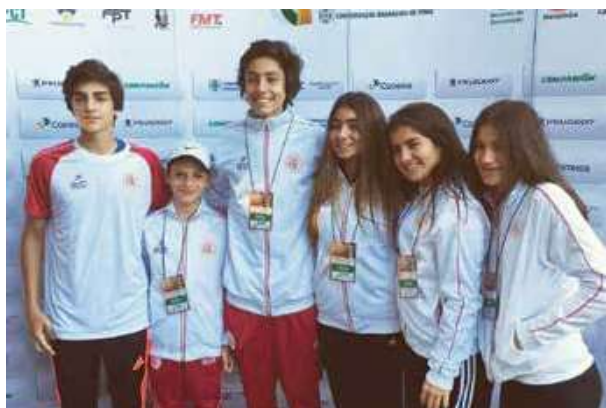
Equipe do Paulistano em Caxias do Sul