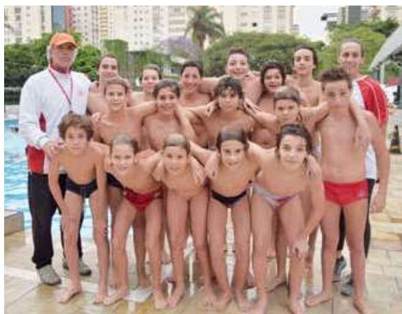
Garotos do polo concluem o ano em alta