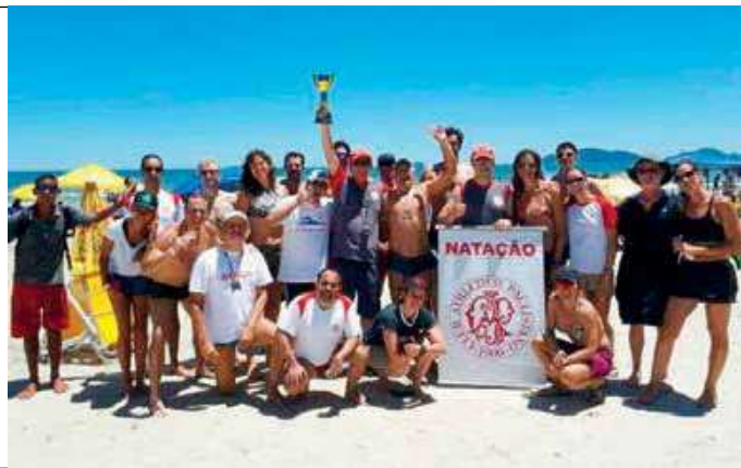
Atletas da turma máster alcançaram vitórias individuais

Os atletas do CAP somaram seis medalhas de ouro, sete de prata e uma de bronze no trajeto de 3 km da etapa da praia da Enseada, Guarujá, pelo Circuito Paulista de Travessias Aquáticas. Além dos pódios das categorias, o Clube conseguiu segundo e quarto lugares entre 89 homens participantes, e segundo, terceiro, quarto e quinto postos entre 34 mulheres. Na disputa entre equipes, o Paulistano acabou com a terceira colocação.