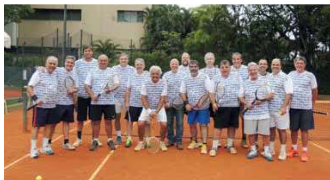
Participantes e suas raquetes do passado