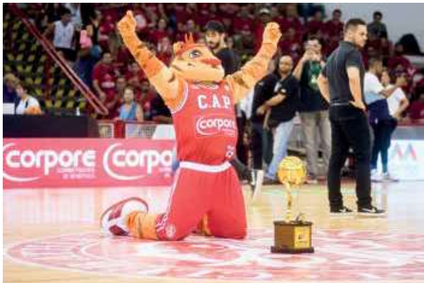
Mascote Fried leva taça do título paulista à quadra