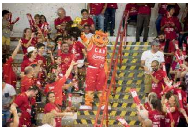
Festa antes da estreia no NBB